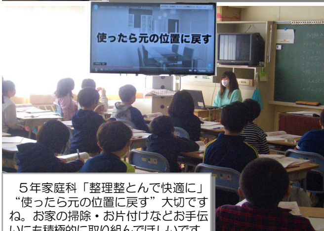
5年家庭科「整理整頓で快適に」“使ったら元の位置に戻す”大切です。お家の掃除・お片付けなどお手伝いにも積極的に取り組んでほしいです。