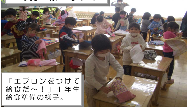
「エプロンをつけて給食だ～！」1年生給食準備の様子。