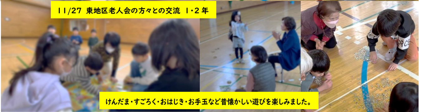
11/27 東地区老人会の方々との交流 1・2年

本校職員は、年に一度、帯広市消防本部の方から心肺蘇生とAEDの使用について訓練を受けています。