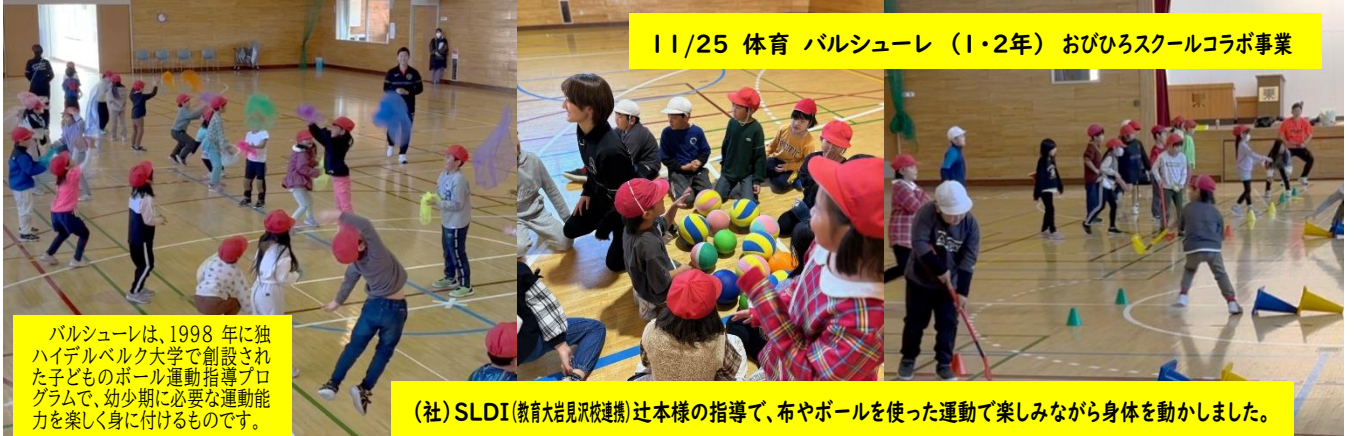
11/25 体育 バルシューレ (1・2年) おびひろスクールコラボ事業

バルシューレは、1998年に独ハイデルベルク大学で創設された子どものボール運動指導プログラムで、幼少期に必要な運動能力を楽しく身に付けるものです。