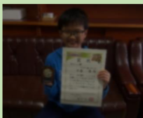
第30回 どうしん小学生新聞グランプリ チャレンジ賞