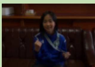
U-10 オータムリーグ 優秀選手賞