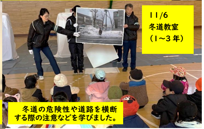
11/6 冬道教室 (1~3年)