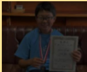
第15回 しかおい トレイルラン 小学生高学年男子 記録 16分05秒 1位 さん(年)