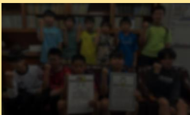
第56回 全道U-12サッカー大会十勝地区予選