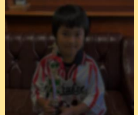
第21回 勝毎杯 全十勝少年サッカー大会 Dブロック優勝 幕別札内FC所属