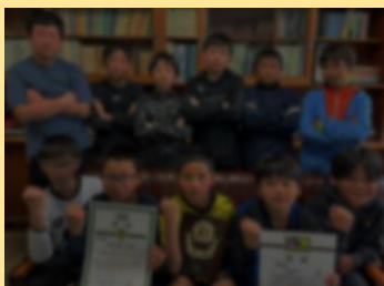
2024 フクハラ杯スプリングフェスティバル 丸大ブロック 準優勝 帯広東 FC