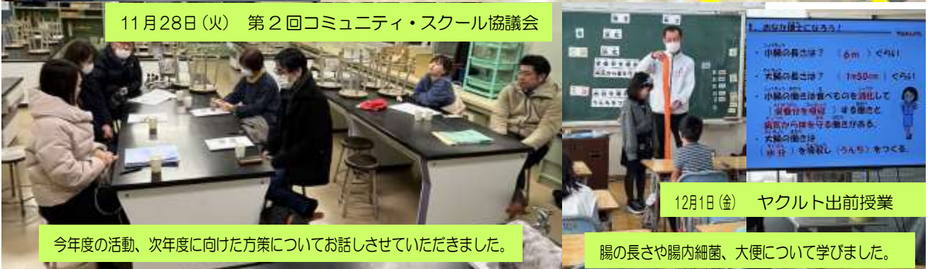
11月28日(火) 第2回コミュニティ・スクール協議会

訓練カリキュラムや費用、学生生活、航空会社への採用等について学んだ後、管制とのやりとりや機体整備の様子を見学し、フライトシュミレーターも体験しました。訓練生に話しを伺う場面もありました。