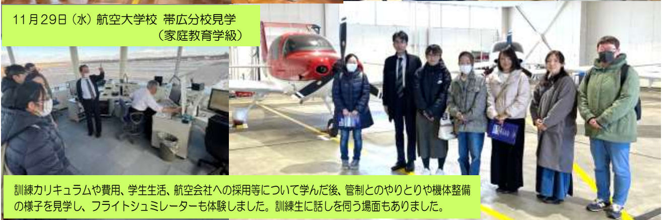
11月29日(水) 航空大学校 帯広分校見学 (家庭教育学級)

新入学児が検査を受けている間に、1年担任から学校生活や持ち物について説明を行いました。