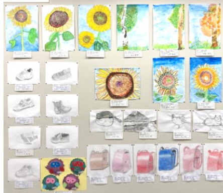
第53回 帯広市小中学校造形展 展示の様子 (帯広市民ギャラリー)