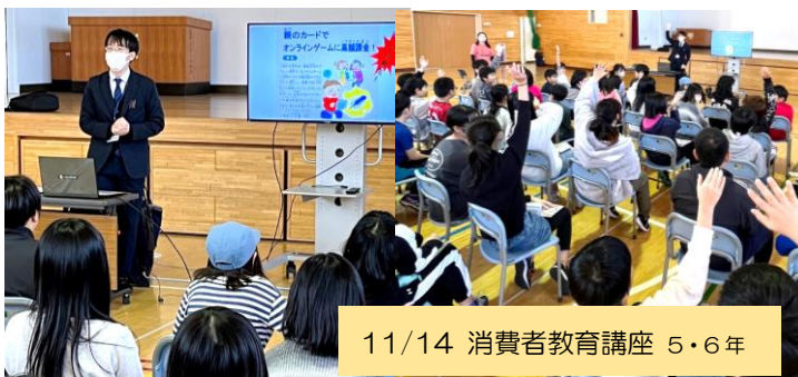
11/14 消費者教育講座 5・6年

北海道消費生活センターの方から、ゲーム課金など消費者トラブルについて学びました。