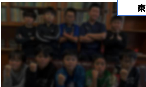
フットサルナイターリーグ 2023 U-11 優勝 帯広東FC