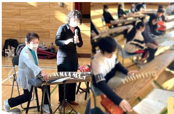
11/15 帯広市民劇場 琴の出前授業 6年

北海道消費生活センターの方から、ゲーム課金など消費者トラブルについて学びました。