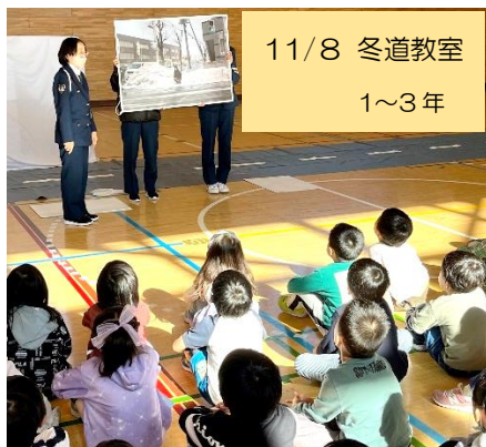
11/8 冬道教室 1～3年

本校では、学習発表会終了後も通常の教育活動に加え、外部講師に指導いただく出前授業や交通指導員による冬道教室等を行いました。また、18日にはPTA主催の東小まつりが4年ぶりに開催されました。更に、今月は私たち教職員も学校を離れ、外部講師からコミュニケーション術を学ぶ研修に参加しました。先月のST研修に引き続き、時代に必要とされる新たな知識を学び続けています。これらの取組を生かしながら、今後もよりよい学校づくり・授業づくりにつなげたいと思います。