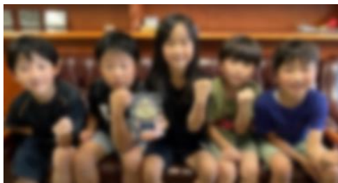
第2回 フレンドリーカップ 優勝