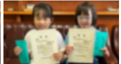
第47回 おびひろ動物園動物画写生コンクール 佳作

気温上昇に伴う安全面を考慮し、東小まつりにつきましては、11月18日(土)に延期させていただきました。