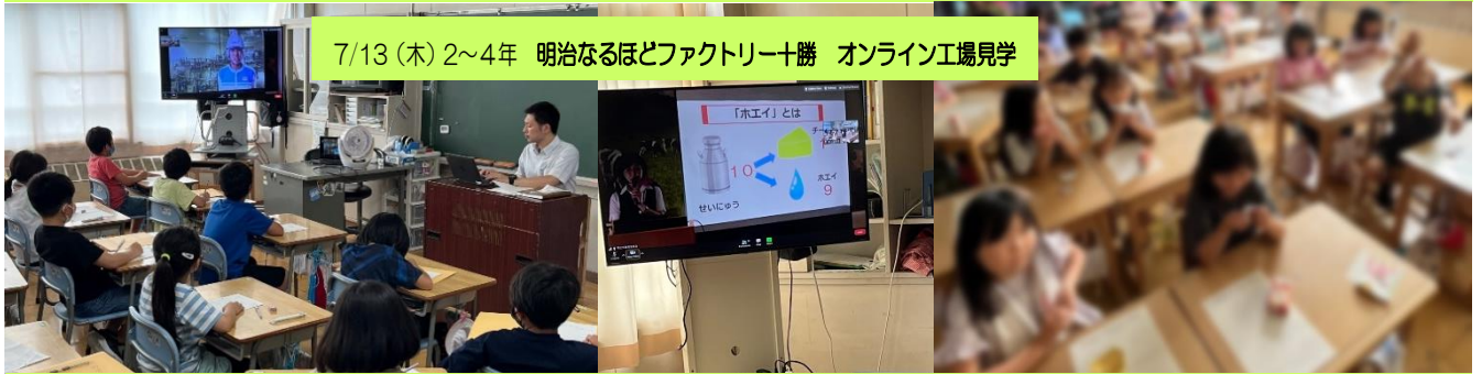
7/13 (木) 2~4年 明治なるほどファクトリー十勝 オンライン工場見学

「ふるさと帯広」に対する誇りと愛着を育み、地域社会の一員として、よりよい地域づくりに関わる子どもを育てることを目的とした「おびひろ市民学」はおび学と呼ばれ定着しています。4年生のアイヌ文化を学ぶ学習は、歴史や地域文化を学ぶ学習として市内全校で実施されているものです。百年記念館の学芸員さんから歴史や文化について説明を受けた後、カムイトボボ保存会の方から歌と踊りを学びました。