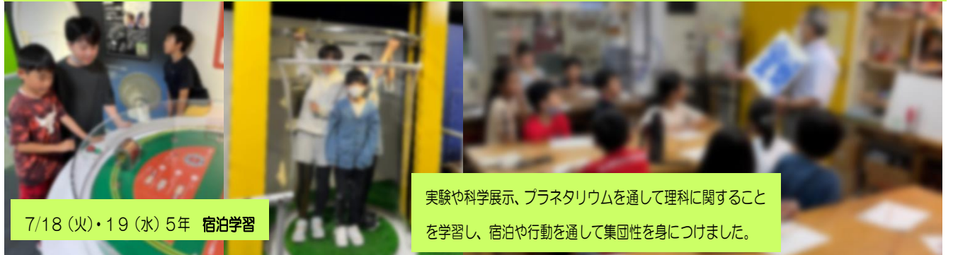
7/18 (火)・19 (水) 5年 宿泊学習

明治十勝工場とオンラインで繋がり、発酵の仕組みやチーズが出来る様子、環境への配慮などを学びました。後半では、実際にチーズを試食し、味わいや食感をコメントに記入しました。本校を含め複数の学校が同時に繋がり、工場の方に質問等に答えいただきましたが、すっかりリモートが定着したこと、オンラインのメリットをフルに生かしているなどあらためて感じました。