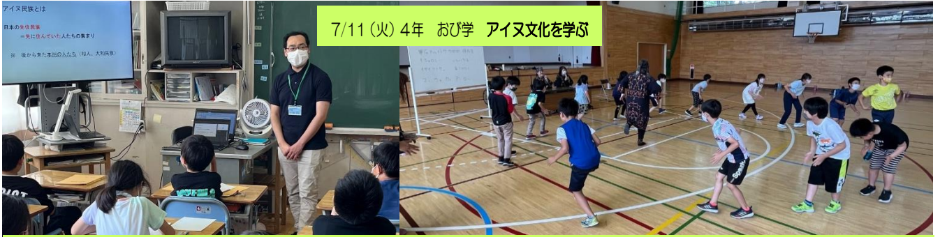
7/11 (火) 4年 おび学 アイヌ文化を学ぶ

「ふるさと帯広」に対する誇りと愛着を育み、地域社会の一員として、よりよい地域づくりに関わる子どもを育てることを目的とした「おびひろ市民学」はおび学と呼ばれ定着しています。4年生のアイヌ文化を学ぶ学習は、歴史や地域文化を学ぶ学習として市内全校で実施されているものです。百年記念館の学芸員さんから歴史や文化について説明を受けた後、カムイトボボ保存会の方から歌と踊りを学びました。