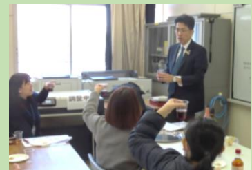
2月4日(水) 家庭教育学級閉級式の様子です。校長講話 の中で、飲料についての詳細と食べ物との相 性についてお話をさせていただきました。